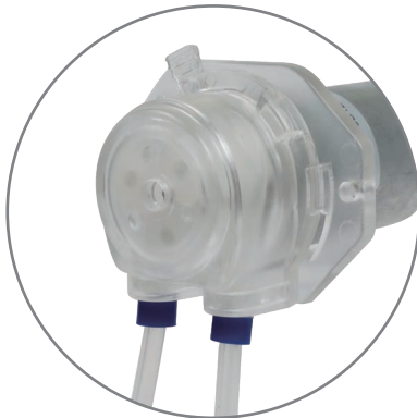
卡管方式: 管套/外置管接头