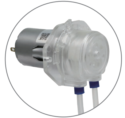
直流有刷、无刷电机