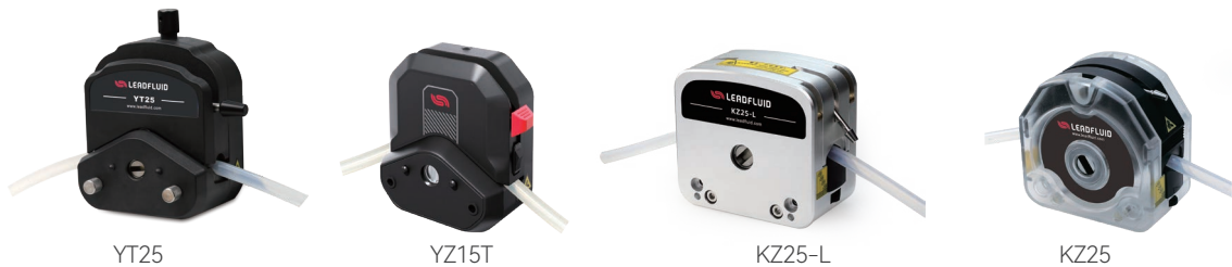
WT600F-65高防护蠕动泵适用泵头及软管、流量参数